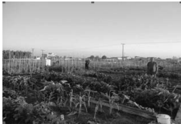
Figure 1– Agros In Tritsi Park, Athens and Bio-agros in Alexandroupoli

The most important and direct product these projects provide are the education services that they give to the society. They transfer knowledge and empower the citizens to grow food by their own. Besides the skills, the education also contributes to the awareness of the citizens about healthy soils and healthy food. Such an attitude helps them to live healthier but can also help to stimulate changes in city's landscape policies and governance.